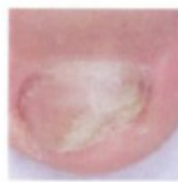
Voor de behandeling

Het is belangrijk om de nagellak te blijven gebruiken totdat de infectie is genezen en totdat er een nieuwe gezonde nagel verschijnt. Dit duurt ongeveer 6 maanden voor de handen en 9- 12 maanden voor de voeten. Hieronder ziet u een aangetaste nagel en daarnaast een gezonde nagel.