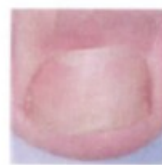
Na de behandeling

Indien u geen verbetering ziet na 3 maanden, moet u een arts raadplegen.